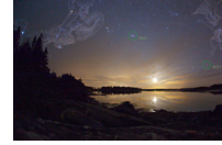
IMAGEN DEL DÍA Y HUMOR